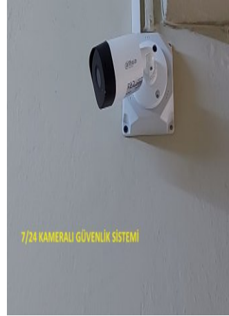
7/24 KAMERALI GÜVENLİK SİSTEMİ