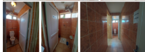
TUVALET ve LAVABOLAR ERKEK & KADIN